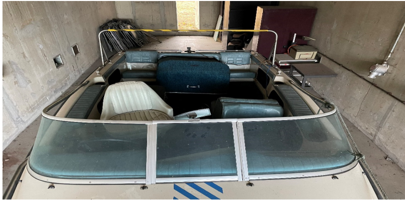
Moteur « inboard »